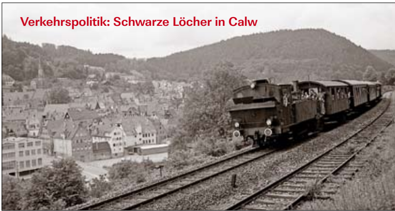
Verkehrspolitik: Schwarze Löcher in Calw