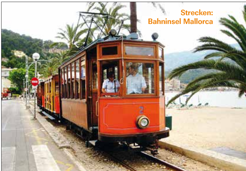
Strecken: Bahnhinsel Mallorca

Originaltriebwagen 2 von 1913 der Straßenbahn Sóller fährt am 14.6.2010 zwischen Palmen entlang der Uferpromenade in Port de Sóller. Mehr zum Schienenverkehr auf der Urlaubsinsel ab Seite