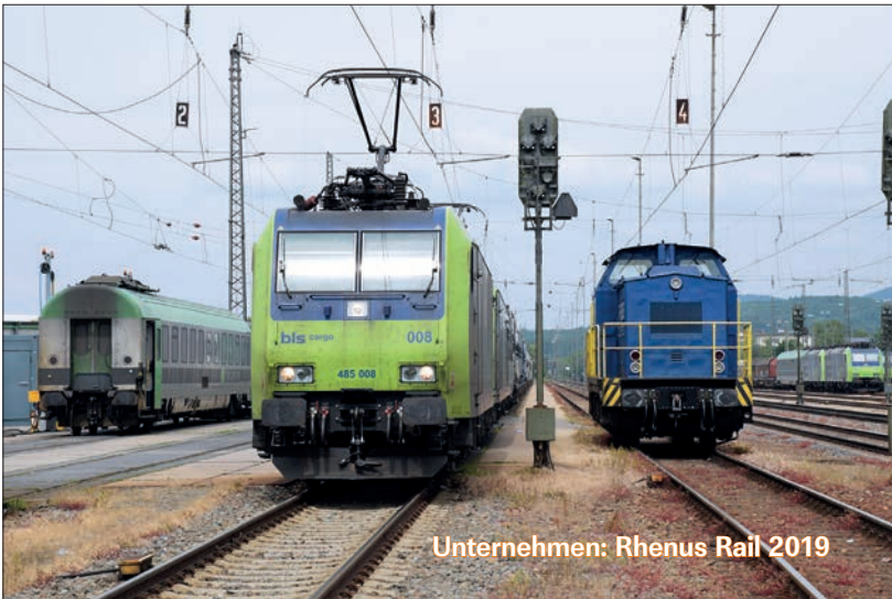
Unternehmen: Rhenus Rail 2019

Rangierleistungen an der Rollenden Landstraße von R-Alpin stellen inzwischen die Hauptaufgabe der Rhenus-Mannschaft in Freiburg dar. Am 24.5.2019 ist Lok 008 von BLS Cargo bereits abfahrtbereit, während Lok 103 von Rhenus auf den nächsten Einsatz wartet. Sein Jahresbericht über Rhenus Rail ab Seite