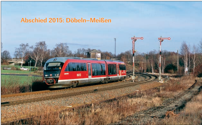
Abschied 2015: Döbeln–Meißen

Elegant legt sich 642 046 am 12.12.2015 in die Bahnhofskurve von Deutschenbora. Seit über fünf Jahren ist der Reiseverkehr Döbeln–Meißen bereits Geschichte, lesen Sie mehr über die Strecke und den Abschied an jenem Tag ab Seite