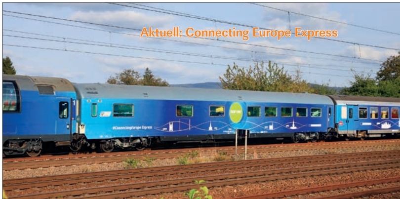
Aktuell: Connecting Europe Express

Im September und Oktober 2021 verkehrte ein besonderer Zug durch Europa, bestehend aus fünf bzw. sechs Wagen aus verschiedenen Ländern. In Zugmitte der italienische Speisewagen 61 83 88-90 110-9 I-TI – Vertreter einer bei der Deutschen Bahn schon vor Jahren ausgestorbenen Spezies, Foto am 28.9.2021 bei Mannheim-Friedrichsfeld: Ulrich Wehmeyer. Claus Strundens Bericht zu diesen Zugfahrten ab Seite