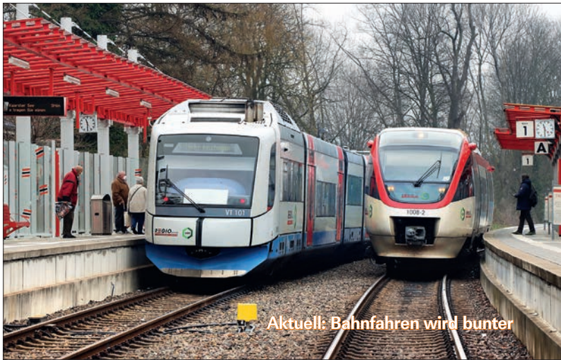
Aktuell: Bahnfahren wird bunter

Zugkreuzung in Mettmann am 10.4.2021. Die bei der Bayerischen Oberlandbahn abgelösten Jenbacher »Integrale« (links: VT 101) fanden bei der Regiobahn eine neue Heimat. Die kurzen »Talente« hingegen hat es nach Rumänien verschlagen, Foto: Martin Wehmeyer. Unser jährlicher Report über die neuen Verkehrsverträge ab Fahrplanjahr 2022 ab Seite